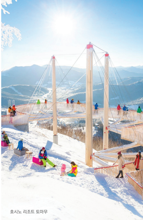
호시노 리조트 토마무