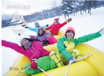
호시노 리조트 토마무