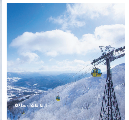
호시노 리조트 토마무