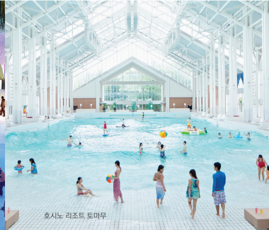
호시노 리조트 토마무