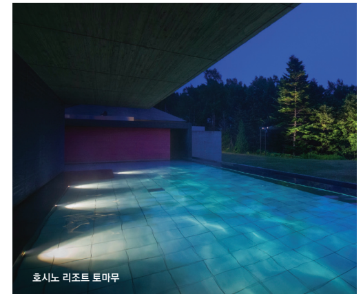
호시노 리조트 토마무