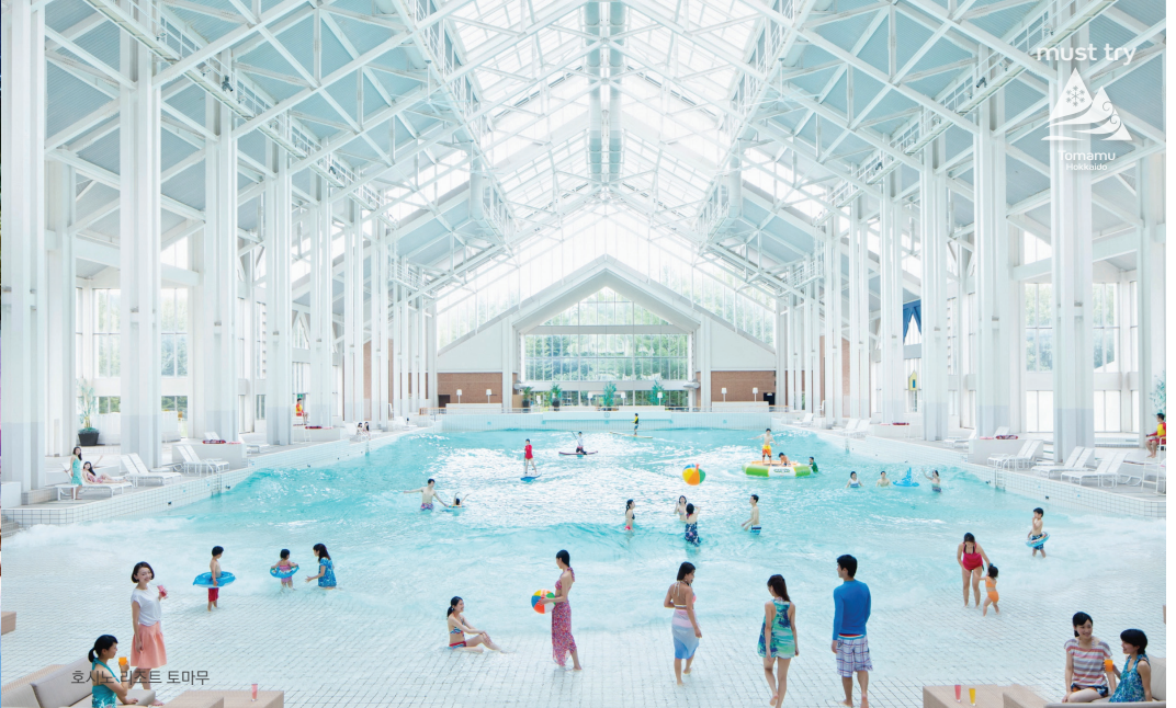
호시노 리조트 토마무