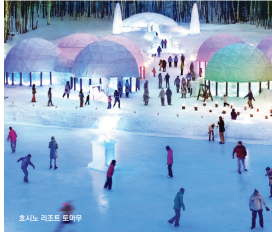
호시노 리조트 토마무