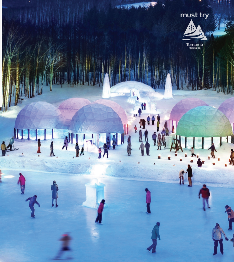
호시노 리조트 토마무